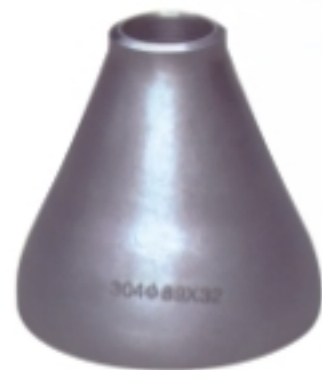
同心异径接头 Reducers concentric