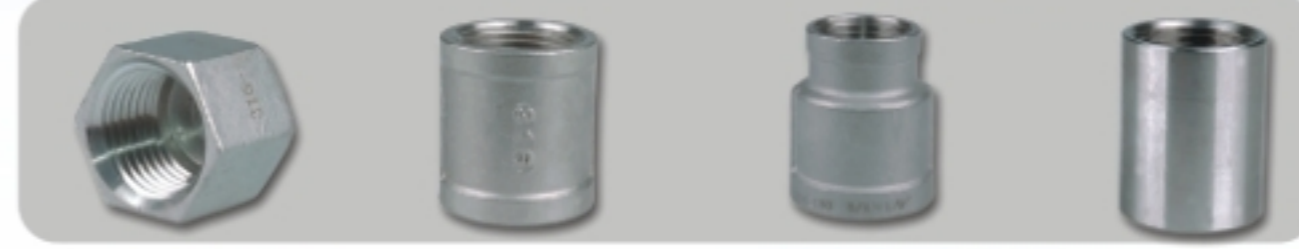
HEXAGON HEAD CAP(HCB) 六角管帽