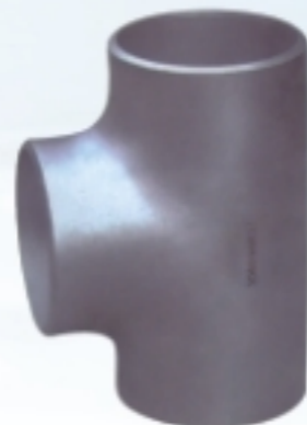
等径三通 Straight tee