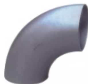
90° 长半径弯头 Long elbow 90°