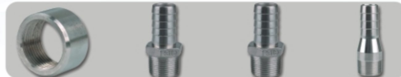
1/2 COUPLING O.D.M(1/2 SPU) 半截光面接头