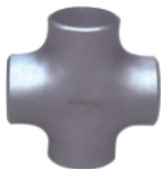
对焊四通 Butt-Weld Reducing Cross