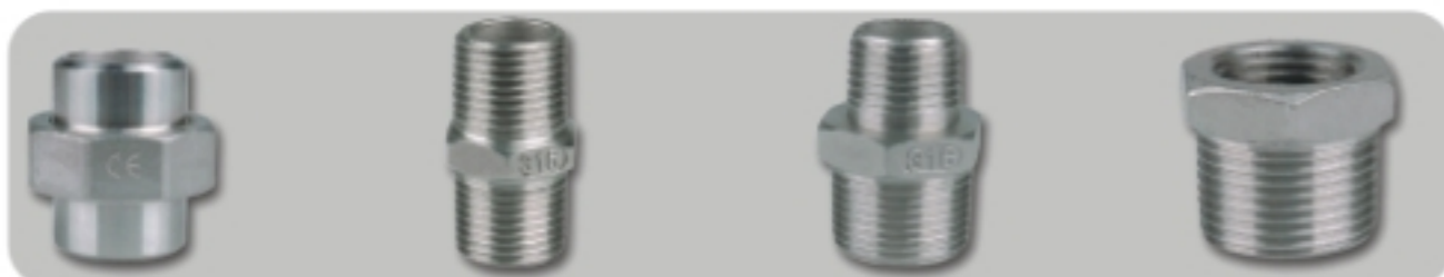
UNION BW 对焊由任