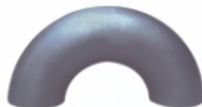
180° 长半径弯头 Long elbow 180°