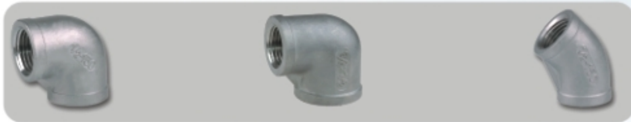
90° ELBOW(90LB) 90度弯头