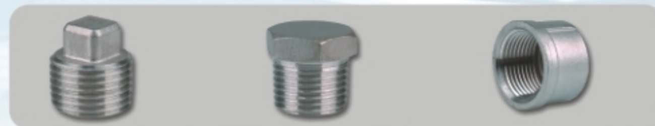
SQUARE PLUG(SQ) 四角塞头