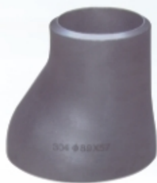
偏心异径接头 Reducers eccentric