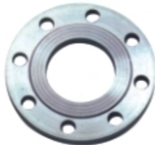
板式平焊法兰 Slip-on welding plate flange