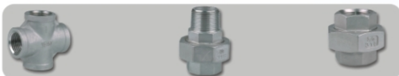
CROSS (+B) 四通