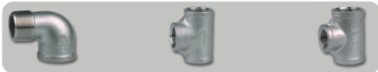
STREET ELBOW(SLB) 内外牙弯头