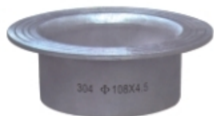
翻边接头 LAP JOINT STUB ENDS