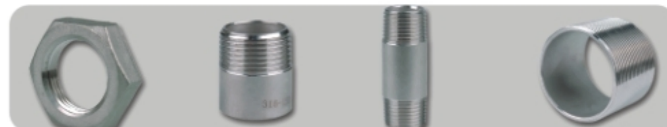
HEXAGON NUT(LN) 六角螺母