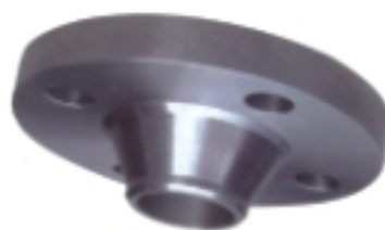
带颈对焊管法兰 Hubbed butt-weld flange